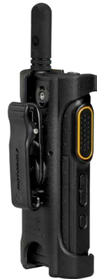
PMLN7190 Futurał/pokrowiec do przenoszenia z obrotowym klipsem do paska

Kompletną listę akcesoriów można znaleźć na stronie www.motorolasolutions.com/SL2600