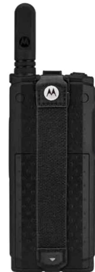
PMLN7076 Elastyczny pasek na rękę